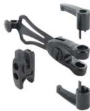
Kit Espagnolette ALU sécurité