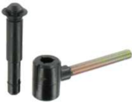
Gond scellement chimique