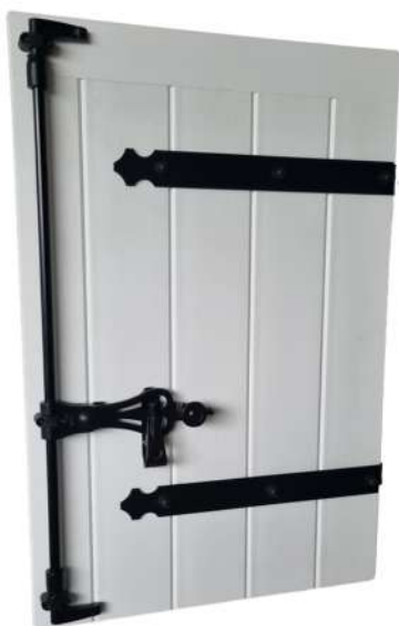
Pentures/contre pentures avec emboiture haute