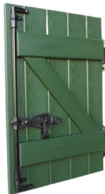
Barres et écharpes