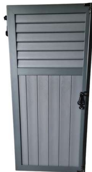
Volet cadre 1/3 américain 2/3 vertical

Les différentes possibilités de remplissage des lames offre un large choix pour la personnalisation de votre volet. Vous pouvez choisir le coloris des lames disponible sur notre nuancier et un laquage du châssis au RAL de votre choix .