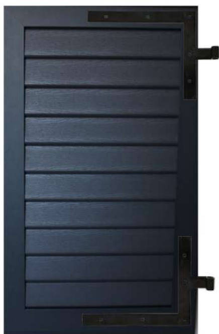
Volet cadre à lames américaines