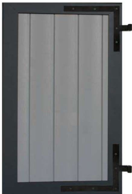
Volet cadre à remplissage vertical