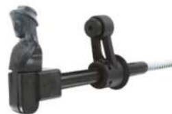
Arrêt tête de bergère