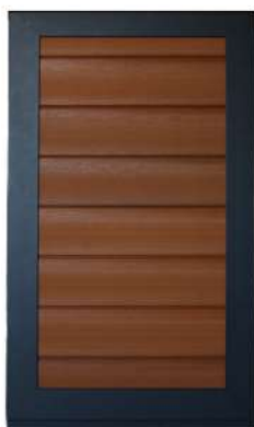
Volet à cadre remplissage horizontal