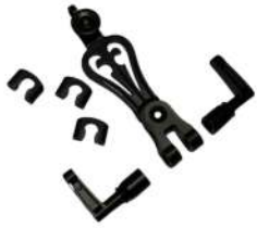
Kit Espagnolette composite ou ALU